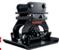
14. Вибротрамбовочные плиты