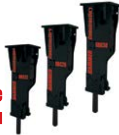
05. Поршневые гидромолоты