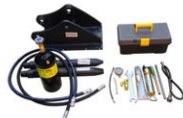
23. Запчасти и сервисное обслуживание