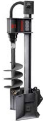
07. Навесные буровые установки