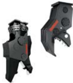
08. Гидравлические ножницы