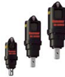
06. Навесные гидробуры