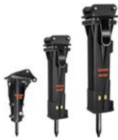
04. Мембранные гидромолоты