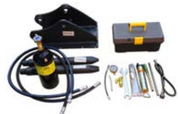
23. Запчасти и сервисное обслуживание